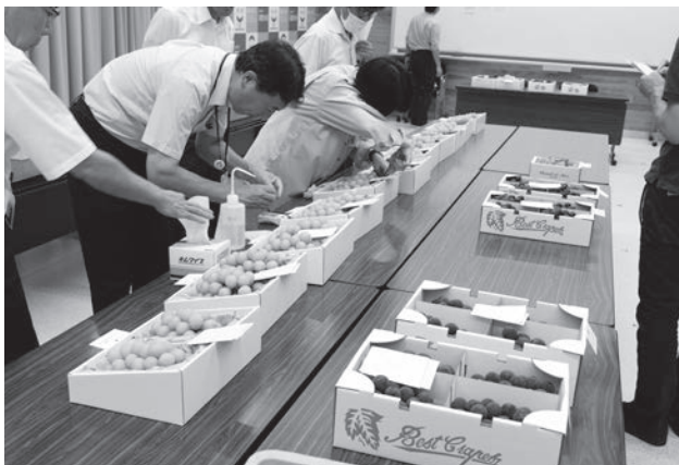
審査では1点ずつ糖度を測っていく